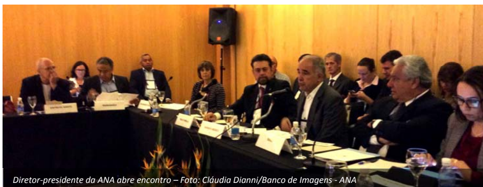
Diretor-presidente da ANA abre encontro – Foto: Cláudia Dianni/Banco de Imagens - ANA

Em 12 de março foi realizada em Brasília uma reunião entre o Secretário Nacional da SRHU, dirigentes da ANA e secretários estaduais de recursos hídricos. Com a participação do Distrito Federal e de mais 20 estados foram discutidas ações conjuntas com vistas a aumentar o nível de segurança hídrica nas diferentes regiões do País, como também identificadas ações programáticas para o alcance dos objetivos das políticas nacional e estaduais de recursos hídricos e para o fortalecimento das entidades integrantes dos sistemas de gestão. Ao final do evento, foi assinada uma Carta em prol da cooperação federativa.