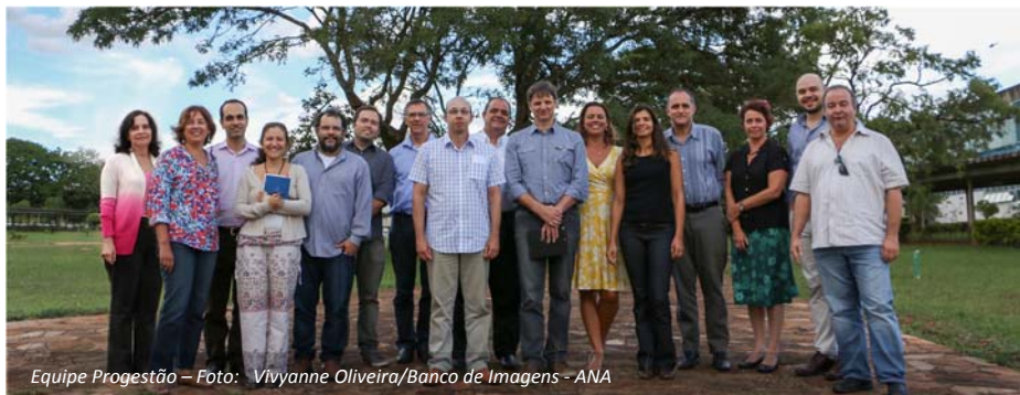
Equipe Progestão

Recentemente a ANA criou em sua estrutura a Coordenação de Apoio e Articulação com o Poder Público (COAPP), área que coordena as ações de acompanhamento do Progestão. Hoje a Agência tem 17 técnicos diretamente envolvidos na condução do Programa, entre a equipe da COAPP e de outras áreas da Superintendência de Apoio ao Sistema Nacional de Gerenciamento de Recursos Hídricos (SAS). São previstas no mínimo duas visitas por ano a cada estado. Quaisquer dúvidas relacionadas ao Programa podem ser dirimidas por meio do e-mail progestao@ana.gov.br .