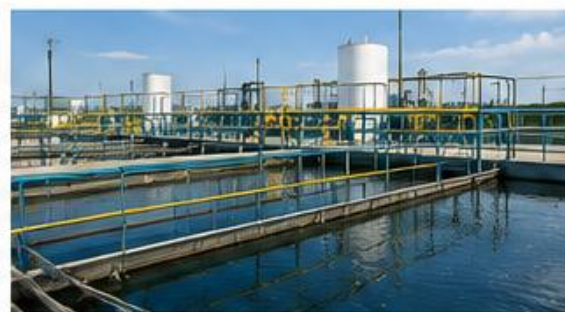
ESTAÇÕES DE TRATAMENTO