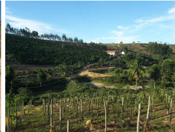
Foto 06 - Barragens em cascata no Córrego Cavallo. Observa-se que mesmo com a falta de água nas barragens e a ausência de chuvas as plantações estão vivas (verdes), indicando existência de água para irrigação (possivelmente subterrânea).