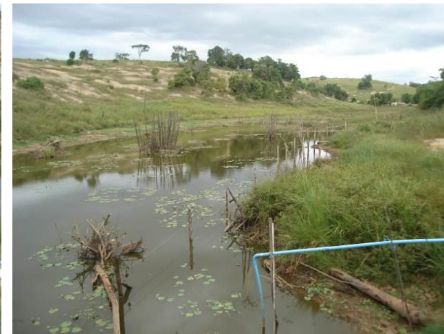
Foto 04 - Reservatório da barragem da Foto 03.