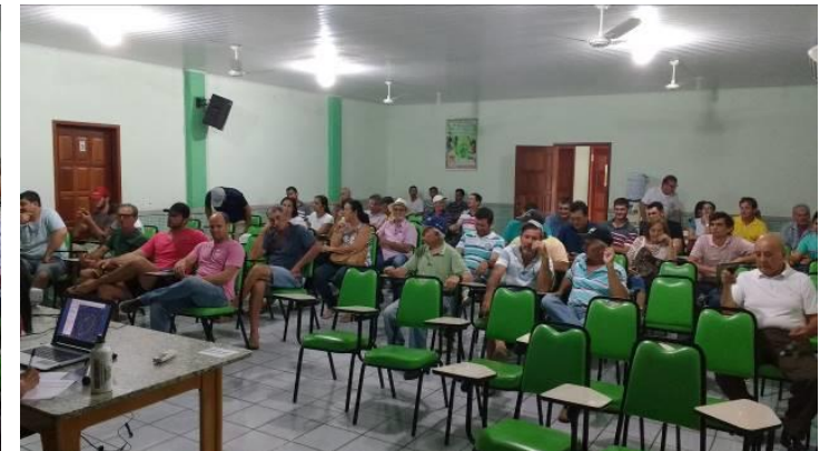
Foto 04 - Usuários de água/produtores rurais da microbacia do Córrego Frigério, presentes na segunda reunião (29/11/2017).