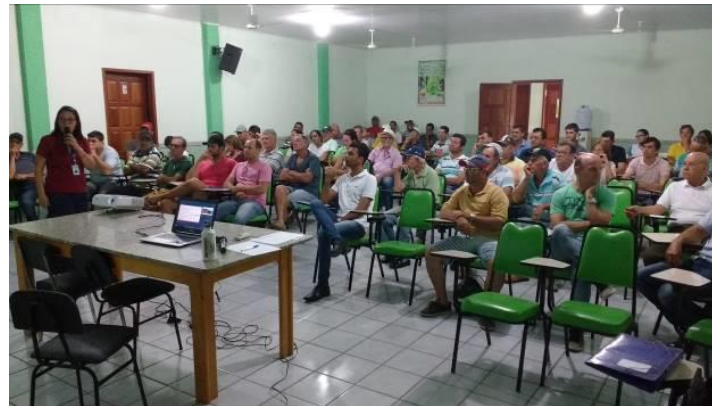
Foto 03 - Segunda reunião com usuários do Córrego Frigério - Nova Venécia/ES (29/11/2017).