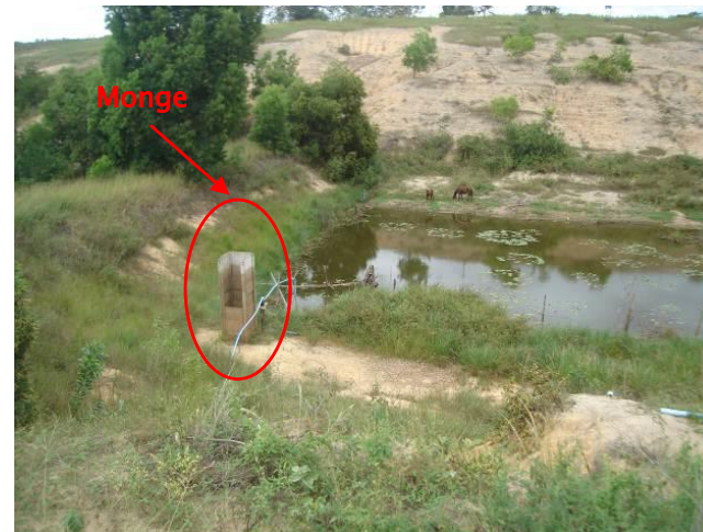
Foto 03 - Barragem a jusante da barragem mostrada na Foto 01. Observa-se o nível da água do reservatório em relação ao monge.