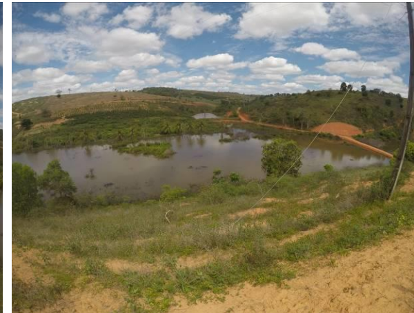
Foto 08 - Trecho do Córrego Frigério, imediatamente a jusante do mostrado na Foto 07.