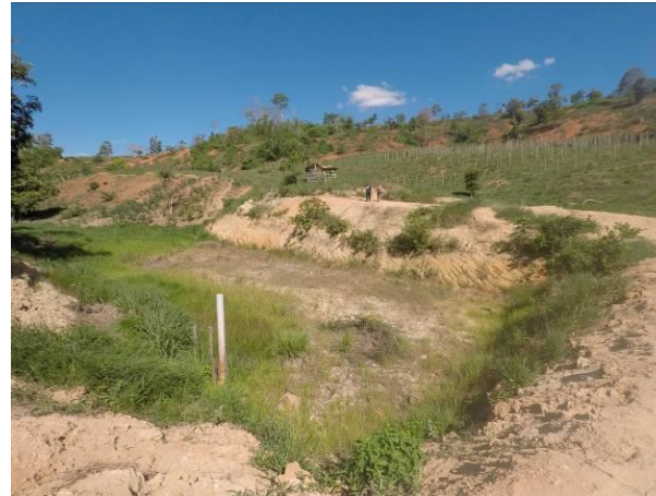
Barragem na cabeceira do Córrego Cavallo.