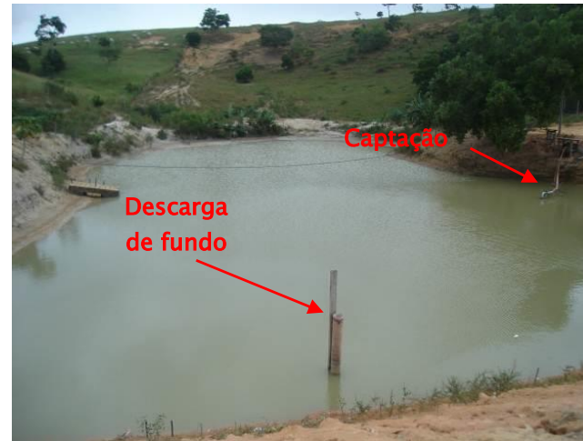
Foto 01 - Reservatório da barragem, localizada na cabeceira do Córrego Frigério.