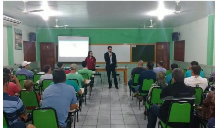
Foto 01 - Primeira reunião com usuários do Córrego Frigério - Nova Venécia/ES (28/06/2017).