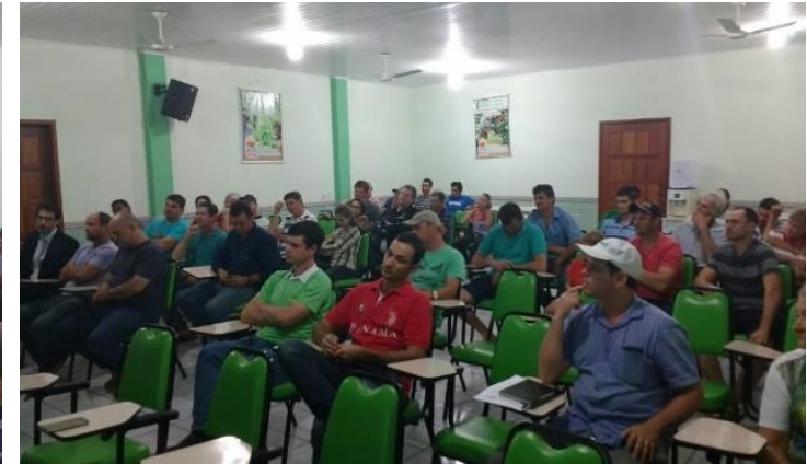
Foto 02 - Usuários de água/produtores rurais da microbacia do Córrego Frigério, presentes na primeira reunião (28/06/2017).