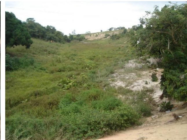
Foto 02 - Jusante da barragem da Foto 01 e montante da foto 03.