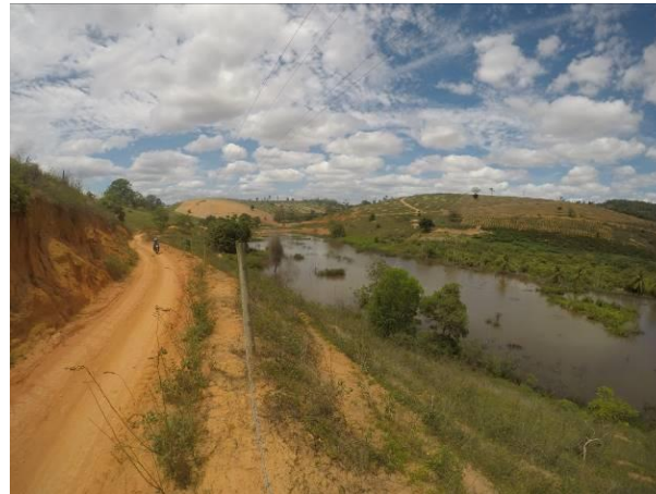
Foto 07 - Trecho do Córrego Frigério, nas proximidades das barragens e travessias