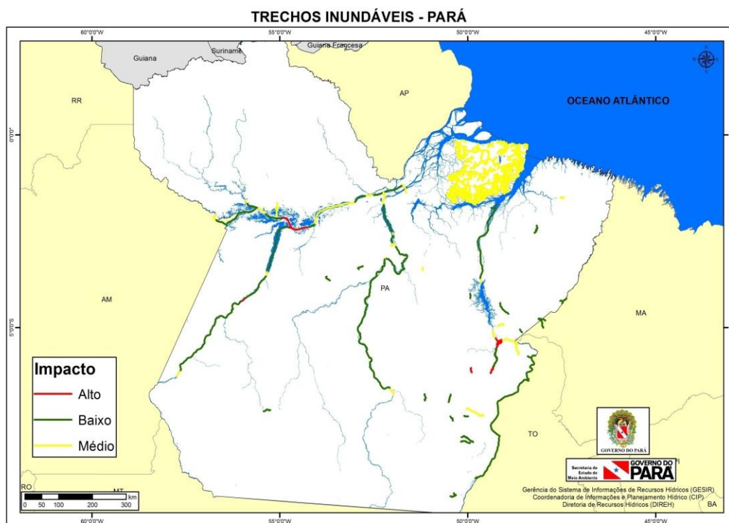
Figura 01: Mapa dos trechos inundáveis no estado do Pará

Para finalizar, agradecemos o apoio e a parceria da ANA e CPRM nas atividades referentes a este ACT e gostaríamos de sugerir, para melhor rendimento e evolução dos trabalhos da Sala de Situação e Gestão da Rede Hidrometeorológica, a troca mais frequente de informações entre as duas instituições, visando uma melhor comunicação e troca de experiências entre as partes.