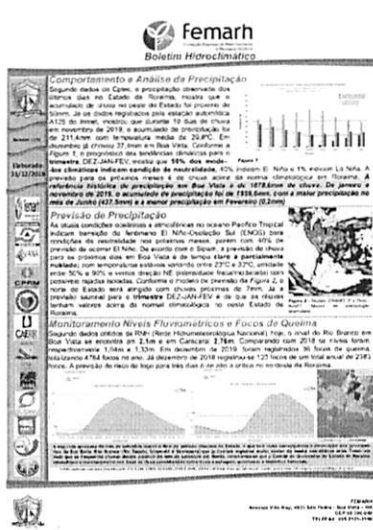
Fig. 1: Frente do boletim Hidroclimático

Anexo do modelo do Boletins Hidroclimáticos produzidos no ano de 2019.