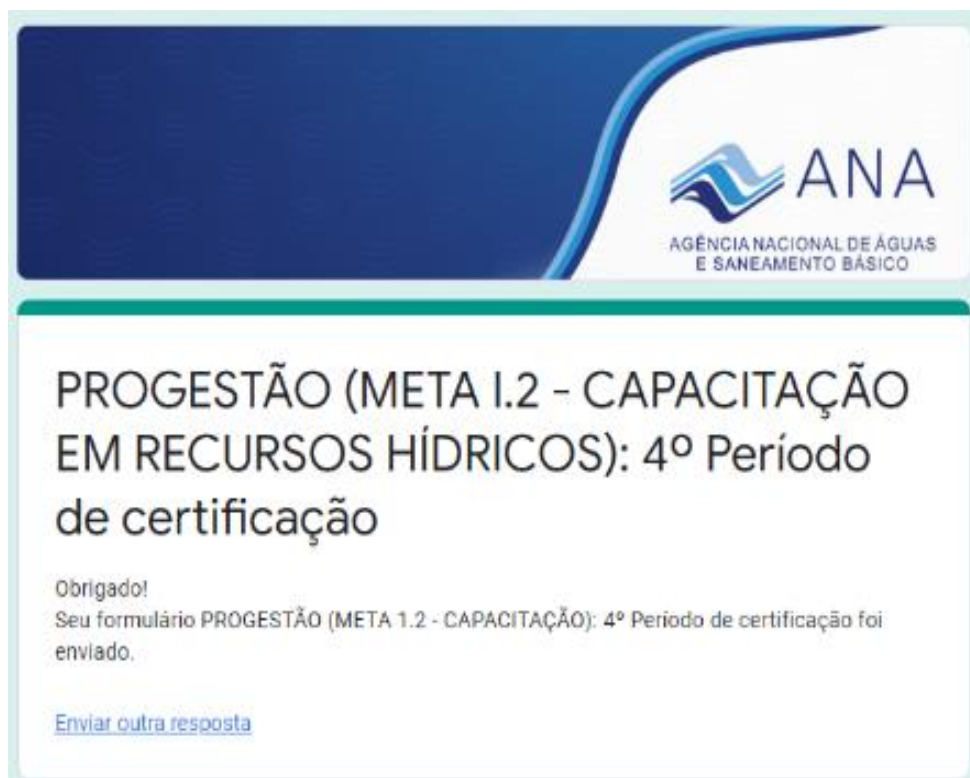
Figura 1 – Comprovante de envio das informações da capacitação em recursos hídricos- 4º Período de certificação.

A planilha padrão com os dados de todos os participantes de capacitações realizadas no ano de 2021 já se encontra compartilhada através de Upload no Formulário do Google (PROGESTÃO - Meta I.2 - Capacitação em Recursos Hídricos- 4º Período de certificação), enviado em 18 de março de 2022, conforme cópia do comprovante abaixo (Figura 1) .