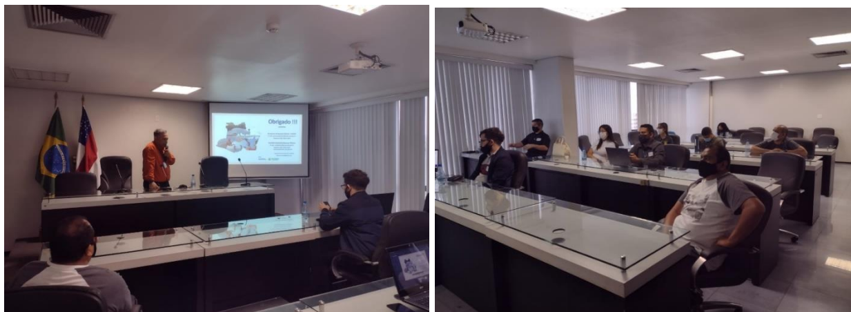
Figura 4- Registro fotográfico da reunião virtual da apresentação para a ALEAM.

Apresentação do Relatório de Gestão de Recursos Hídricos ocorreu em 30 de novembro de 2021, na Assembleia Legislativa do Estado do Amazonas (ALEAM), para a Comissão de Meio Ambiente e Desenvolvimento Sustentável (CAAMA), Comissão de Geodiversidade, Recursos Hídricos, Minas, Gás, Energia e Saneamento (CGEO) e membros do Conselho Estadual de Recursos Hídricos e demais convidados. Houve também transmissão de forma virtual pela Plataforma Microsoft Teams pelo link: https://teams.microsoft.com/l/meetup-join/19:meeting_MTEyNDUxOWUtYjEwMi00ZDdkLWFmZWUtZDVhNjc3ZGMxZDdi@thread.v2/0?content=%7B%22Tid%22:%22285473998-1f81-4011-bc97-87ae04e61204%22,%22Oid%22:%224bb1bd60-84bd-4f3e-87ff-524408255f99%22%7D . Abaixo, estão apresentados o convite para a apresentação, enviado ao Conselho Estadual de Recursos hídricos e fotos da apresentação. (Figura 4 e 5).