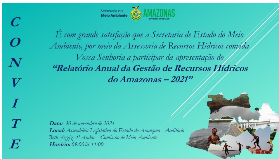
Figura 5-Convite enviado ao CERH, CAAMA e CGEO.