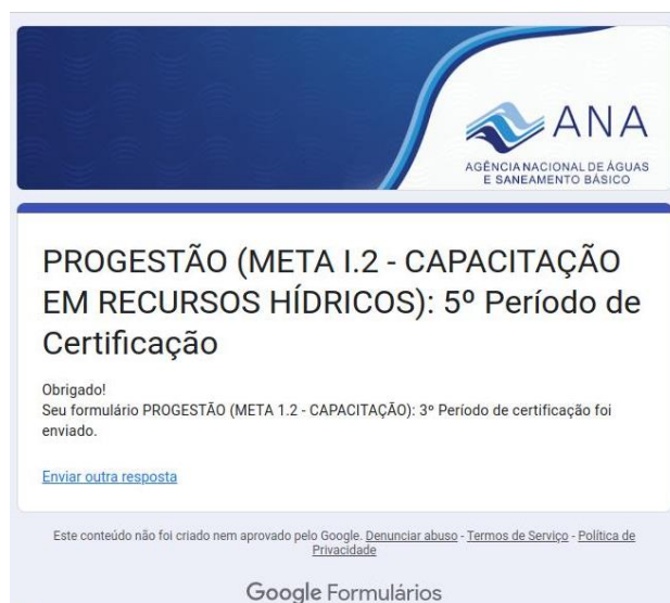
Figura 1: Comprovante de atendimento da meta I.2

O formulário autoexplicativo específico para o Estado - link indicado no Informe 3/2023 ( https://bit.ly/ANAPG_5PC ) foi preenchido, conforme comprovante gerado a seguir.