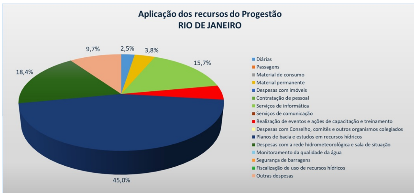
Distribuição da aplicação dos recursos pelo Rio de Janeiro ao longo de todo o Progestão

35. Somando-se todos os recursos aplicados pelo estado ao longo dos dez anos do Progestão, tem-se o montante de R$ 2.015.843,56 . A Figura a seguir apresenta a distribuição pelas diversas rubricas dos desembolsos realizados pelo estado ao longo de todo o programa, com destaque para "Planos de bacia e estudos em recursos hídricos", que representaram 45%.